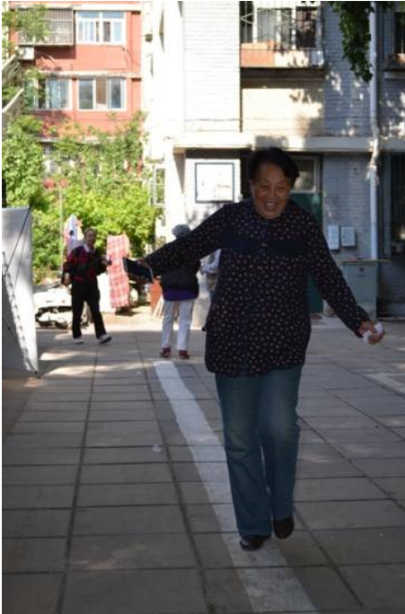
Photo 5 (à gauche) : Habitante marchant suivant la ligne blanche peinte sur le sol du shequ 社区 afin de vérifier si elle marche toujours droit (Photo prise sur le site internet de l'organisation. Elle date de mai 2016 et a été prise lors d'activités organisées par l'organisation.)