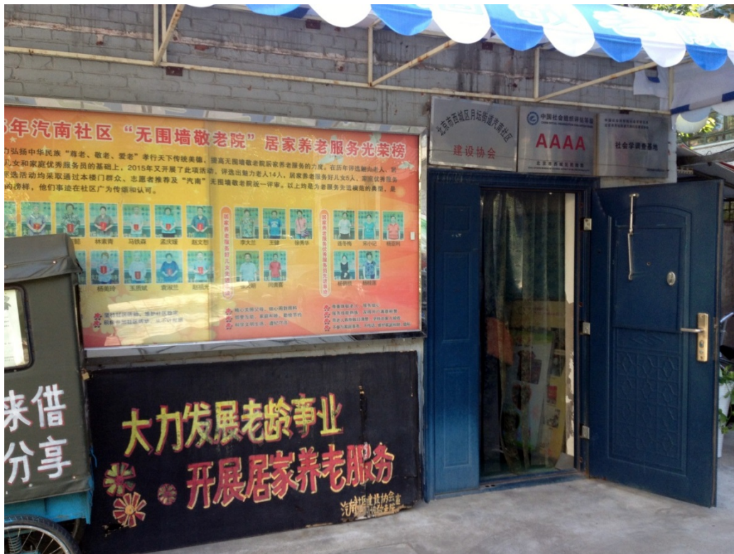
Photo 1 : La porte d'entrée du bâtiment de gestion du shequ 社区 (au centre de celui-ci) et le tableau d'honneur félicitant certains individus (Photo MB, septembre 2016)

Par ailleurs, l'espace, et plus particulièrement celui du centre de gestion du shequ 社区, est marqué par de nombreuses bannières rouges donnant certaines injonctions quant à l'utilisation de ces espaces. Ainsi sur la photo ci-dessous, la bannière du haut de l'image indique « Pièce de la joie et du bonheur de l'organisation « sans mur d'enceinte » » ; celle de droite rappelle le soutien de telle institution publique et l'orientation de lien social qui est au cœur du projet. Il en est de même avec les différentes plaques en métal ornées de quelques caractères, que l'on retrouve à la fois sur la façade extérieure et à l'intérieur du bâtiment (cf. photo 1 et photo 2). A chaque fois, il y a rappel de l'insertion dans un tissu institutionnel plus large (celui du comité de quartier, du district, de telle ou telle université qui pense ces lieux en termes « d'innovation sociale » et y mène alors des recherches-actions).