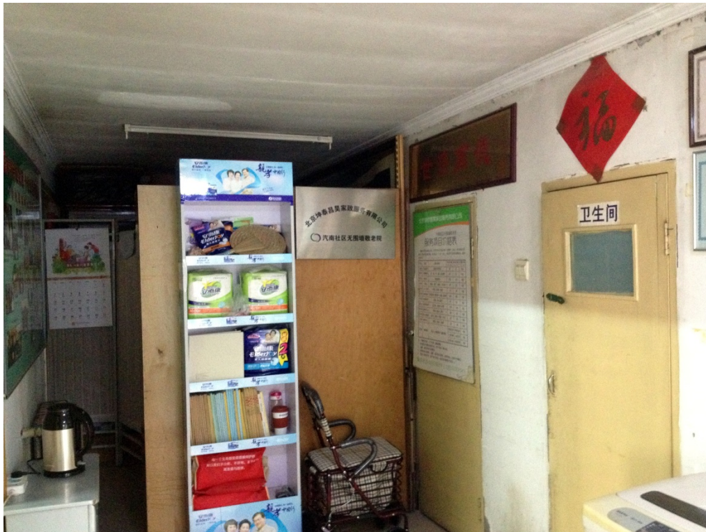
Photo 3 : Entrée du bâtiment d'administration du shequ 社区, présentoir et produits siglés d'une entreprise spécialisée dans les produits pour personnes âgées (Photo MB, septembre 2016)

Cet agencement entre action étatique fortement marquée par une tradition socialiste et formes de capitalisme avec la participation d'entreprises privées est d'ailleurs largement souligné dans le site internet de l'organisation, précisant que les modes de prise en charge du vieillissement au sein de ce shequ 社区 se font par un projet « supporté par le gouvernement, pris en charge par les organisations de la société civile et opéré par la marketization (市场化) 7 ».