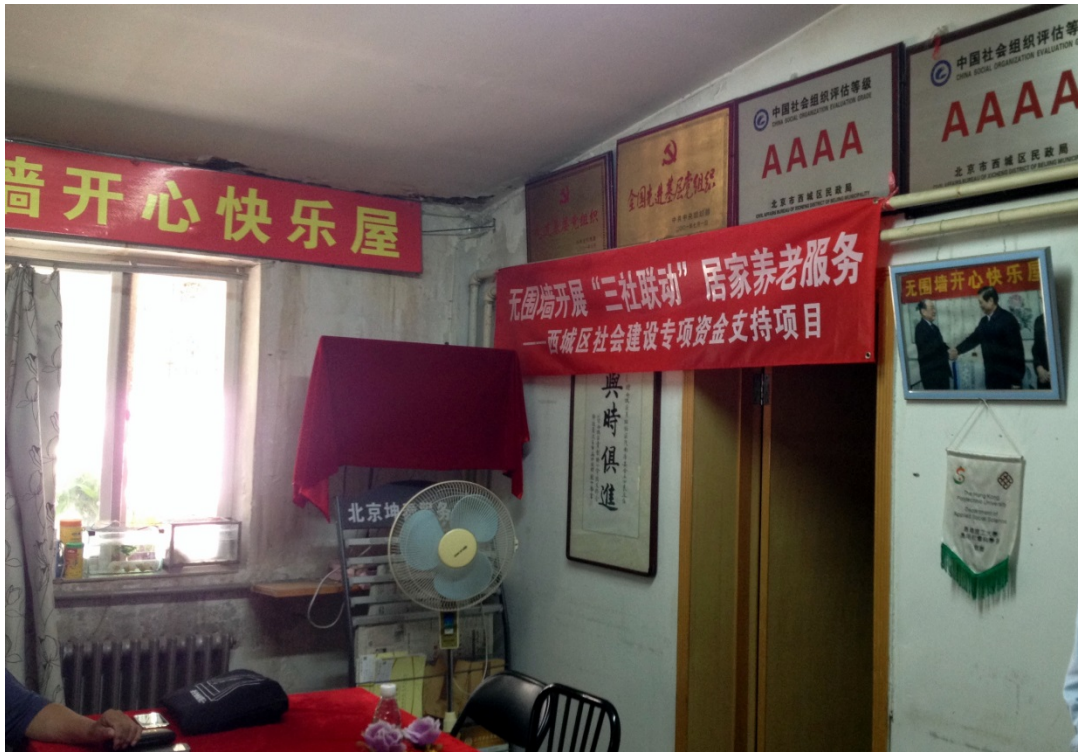
Photo 2 : Photo prise à l'intérieur du bâtiment, dans la salle où nous sommes reçus (Photo MB, septembre 2016)

Les marques d'un système hérité de la tradition socialiste sont également visibles sur le site internet de l'organisation 4 qui s'occupe de prendre en charge les personnes âgées de ce shequ 社区. Ainsi, un des onglets sur la page d'accueil s'intitule « 为老服务 », c'est-à-dire « Servir la vieillesse », faisant ainsi, sans aucun doute, l'écho du slogan maoïste 为人民服务 « Servir le peuple ». De même, toujours sur ce même site, la personne du président de l'organisation, chargé de nous faire une présentation du shequ 社区 lors de la visite, est soulignée par un rapide CV, quasi hagiographie du parcours type d'un cadre du parti communiste chinois :