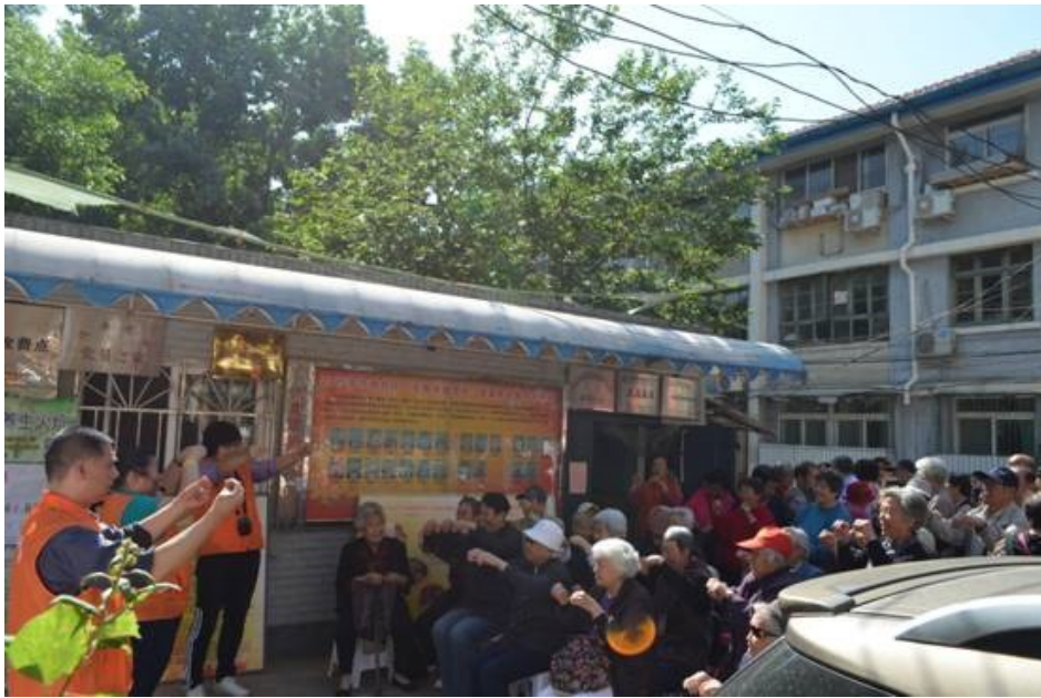
Photo 7 : activité collective proposée par le shequ 社区 aux habitants âgés et pris en charge par des bénévoles habillés de orange

membre de l'organisation, sinon quelqu'un pourrait arriver et leur piquer leur argent 8 ». Un certain nombre de bénévoles et de travailleurs sociaux sont présents au sein du shequ 社区 et donnent à voir une prise en charge de l'individu comme au temps de la « danwei » intégratrice, au moins pour les personnes âgées dans ce cas. Ceci se décline autour de temporalités individuelles, comme lorsqu'il s'agit d'accompagner quelqu'un au dispensaire, et de temporalités collectives dans la pratique d'activités communes (cf. photos 4, 5, 6 et 7).