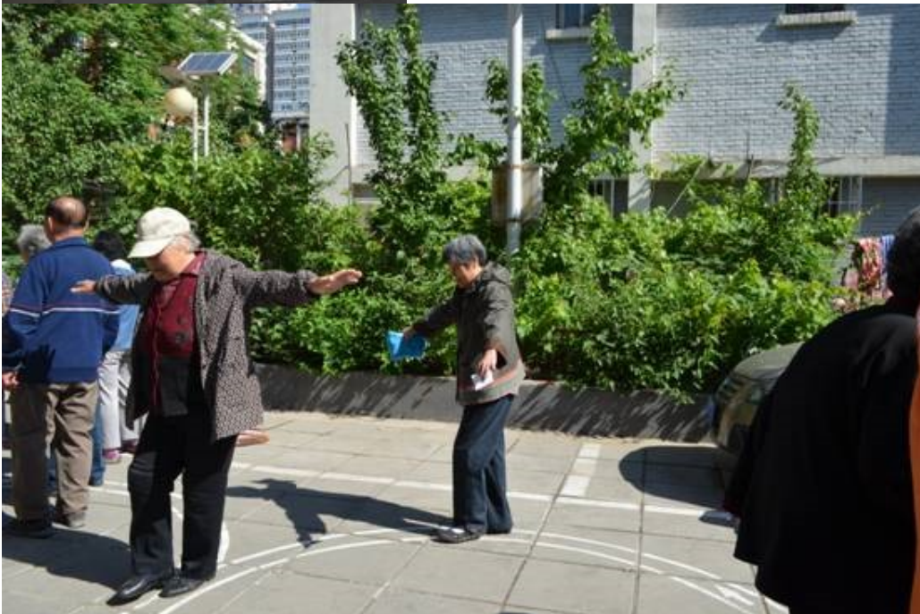
Photo 6 (ci-dessous) : Habitantes marchant le long de lignes courbes peintes sur le sol dans les espaces publics du shequ 社区 afin de vérifier qu'elles arrivent encore à marcher en suivant une ligne. (Photo prise sur le site internet de l'organisation. Elle date de mai 2016 et a été prise lors d'activités organisées par l'organisation.)

Dans ce shequ 社区, les personnes âgées sont des individus qui sont fortement intégrés dans un agencement institutionnel qui, en continuité des pratiques du temps de la danwei 单位, organise et prend en charge chacun dans ses activités quotidiennes culturelles, sportives, médicales, etc. Cela va même jusqu'à des pratiques quotidiennes simples comme le fait de retirer de l'argent, action pour laquelle les personnes âgées sont « accompagnées par un